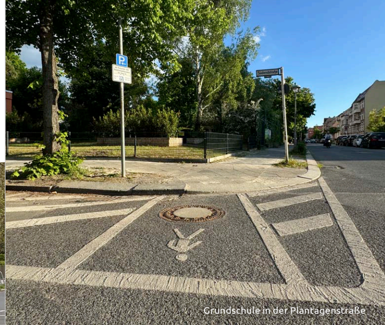
Grundschule in der Plantagenstraße

Vor der Giesensdorfer Grundschule wurde am Ostpreußendamm ein Dialogdisplay aufgestellt sowie die bestehende Tempo-30-Zone erheblich erweitert.