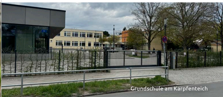
Grundschule am Karpfenteich

Gegenüber der Grundschule am Karpfenteich wurde in der Hildburghäuser Straße eine Halteverbotszone angeordnet. Ein Fußgängerüberweg an der Mariannenstraße Ecke Georgenstraße, wo sich eine von vielen Schülerinnen und Schülern genutzte Bushaltestelle befindet, soll noch in diesem Jahr ein Fußgängerüberweg eingerichtet werden.