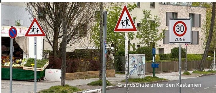
Grundschule unter den Kastanien

Vor der Grundschule unter den Kastanien in Lichterfelde-Ost weisen an der Einfahrt der Brauerstraße seit kurzem zwei Schilder „Achtung Kinder“ auf die kleineren Verkehrsteilnehmer hin. Zusätzlich wurde auch hier ein Dialogdisplay installiert.